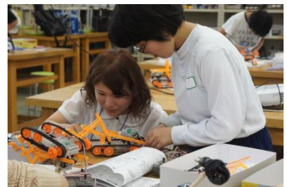
女子学生も頑張って、ロボットの作り方を教えます。