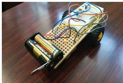
皆さんに作ってもらうライトレースロボットの一例です。