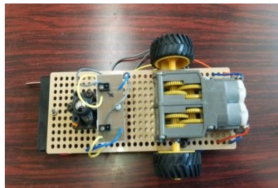
センサーや車輪を改造してオリジナルのロボットを作ります。