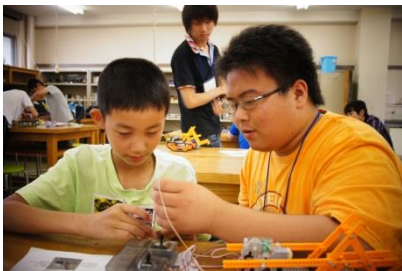
男子学生も頑張って、ロボットの作り方を教えます。