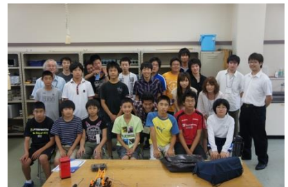
最後に集合写真を撮ります。完成したロボットは持ち帰れます。